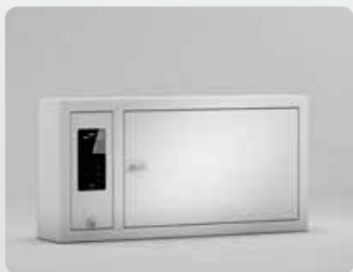
9400 SC Máximo 42 espacios para llaves, 3 tiras