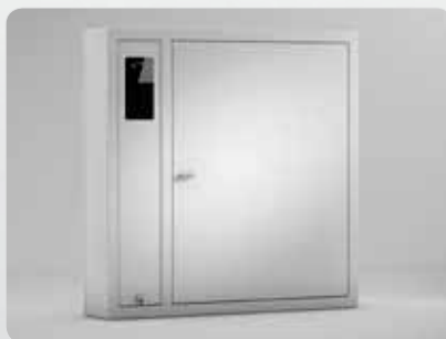
9500 SC Máximo 84 espacios para llaves, 6 tiras