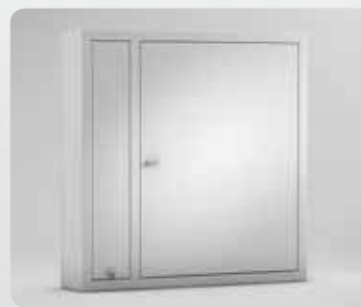
9500 EC Máximo 84 espacios para llaves, 6 tiras