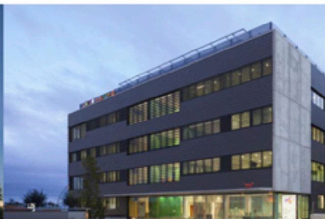
Hospital Sant Joan de Déu, Barcelona