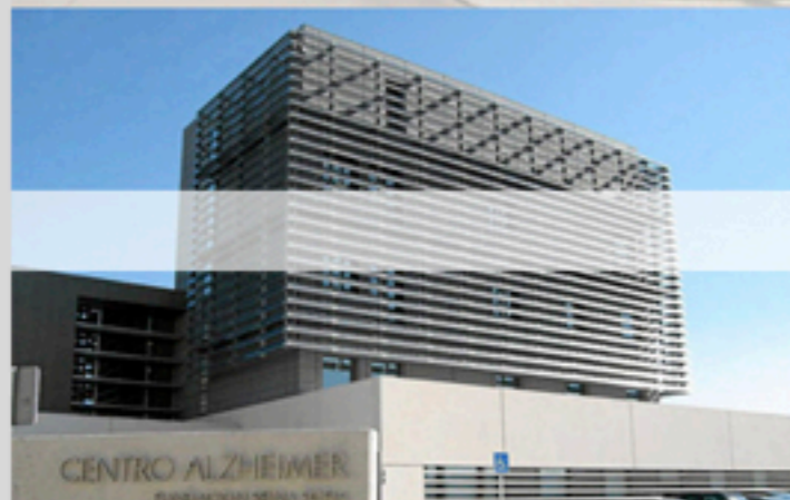
Centro Alzheimer León – Fund. Reina Sofía