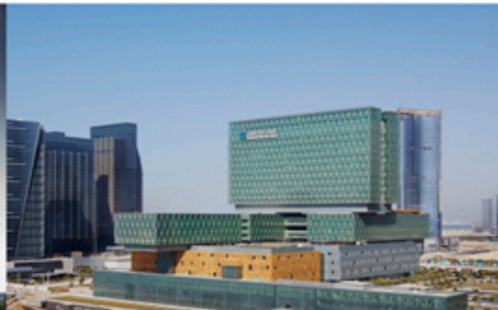
Cleveland Clinic - Abu Dhabi, UAE