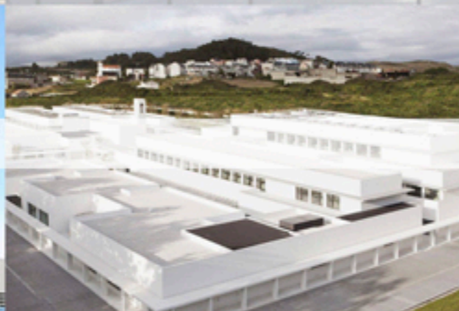
I. Benéfico Social Padre Rubinos – A Coruña