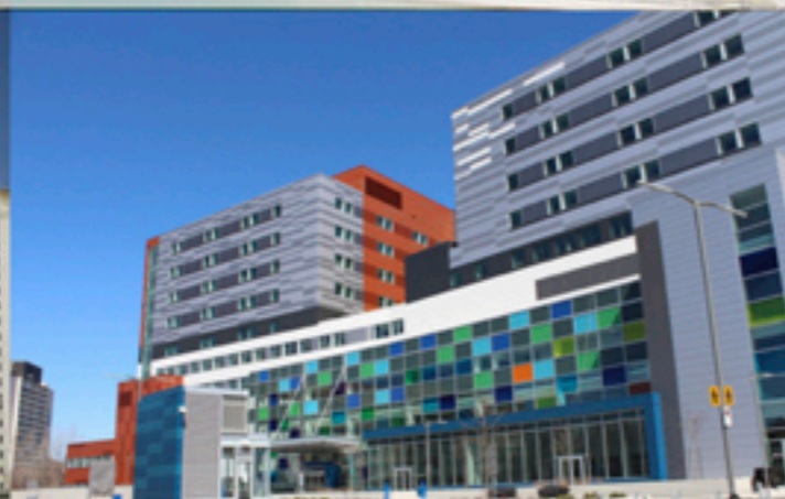
McGill Health Center - Montreal, Canada