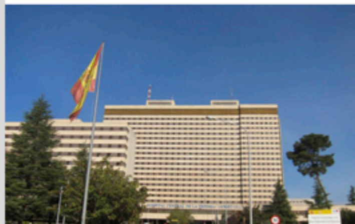
Hospital Militar Gómez Ulla, Madrid